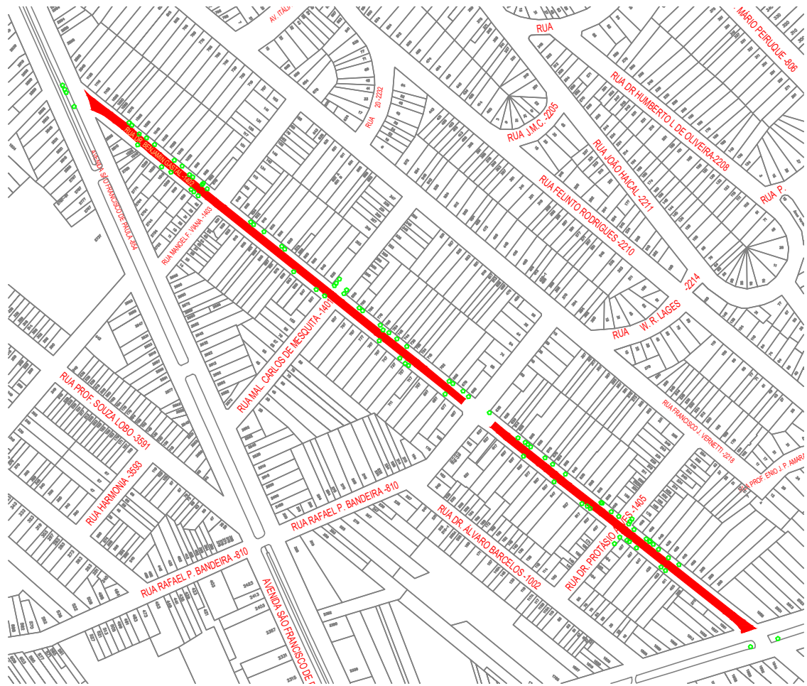
01 | PLANTA DE SITUAÇÃO ESCALA: 1:500